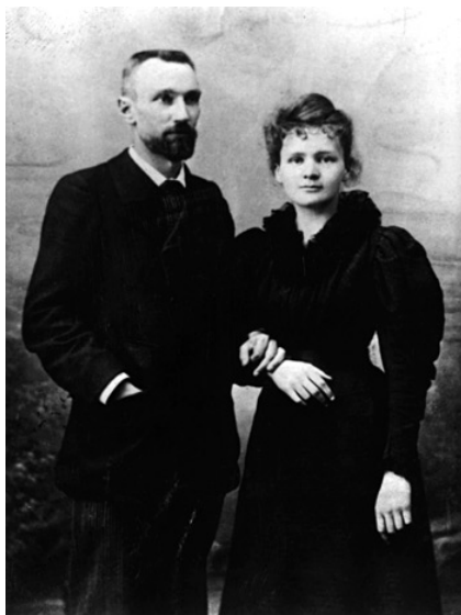
Figura 3. Foto oficial "del matrimonio".

ciencias, el primero que se habría de conceder a una mujer en la Sorbona. Con este trabajo Marie obtendría mucho más que un título de doctora, pasaría a la posteridad. Cuando Marie conoció a Pierre, éste ya era un científico que había realizado contribuciones muy relevantes en varios campos – además del estudio de las propiedades magnéticas objeto de su tesis doctoral, había descubierto la piezo-electricidad junto con su hermano mucho antes, y había estudiado las propiedades de simetría de los cristales–. A pesar de ello, Marie no se limitó a seguir la brillante estela de Pierre. Ella estaba fascinada por la naturaleza de las misteriosas radiaciones que acababa de descubrir Henri Becquerel, y decidió estudiarlas desde una perspectiva diferente a la que había empleado el eminente profesor de la Escuela de Minas y director del laboratorio del Museo de historia natural de París. Curiosamente, donde fracasó la experiencia y la tradición de Becquerel, cuya familia había estudiado las radiaciones emitidas por los minerales durante cuatro generaciones, triunfó Marie. Según algunos triunfó la aproximación química donde había fracasado la física, pero en realidad había mucha física en la cuantificación del fenómeno que hizo Marie. También hubo genialidad a la hora de plantear las preguntas y un incommensurable trabajo para obtener las respuestas acertadas.